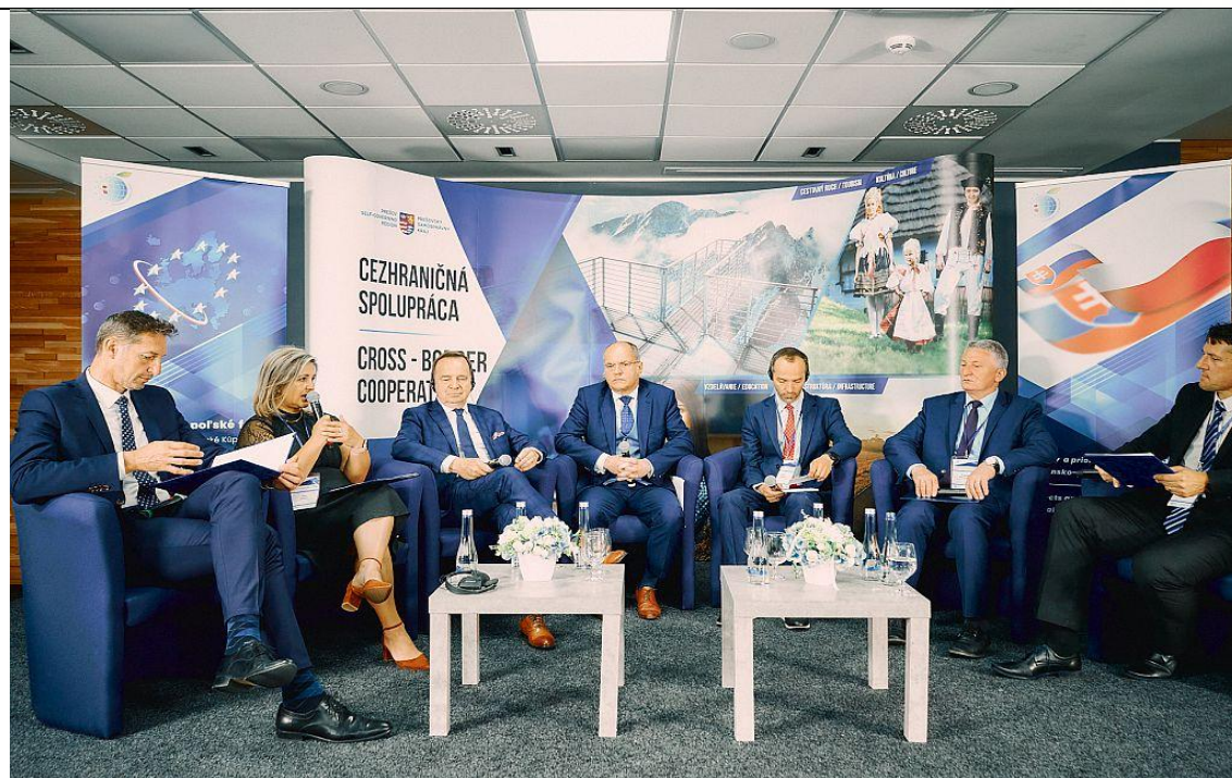
III. Slovensko-poľské fórum v Bardejove dňa 15. júna 2022